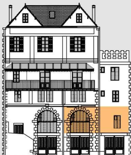
Rue du Thau

Les cotes et les surfaces sont susceptibles de légères modifications pour tenir compte des contraintes éventuelles lors des travaux, et des impératifs architecturaux ou techniques.